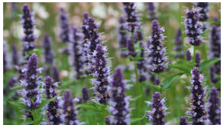
Agastache 'Black Adder'