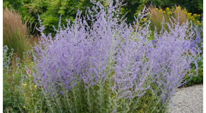
Perovskia atriplicifolia 'Blue Spire'