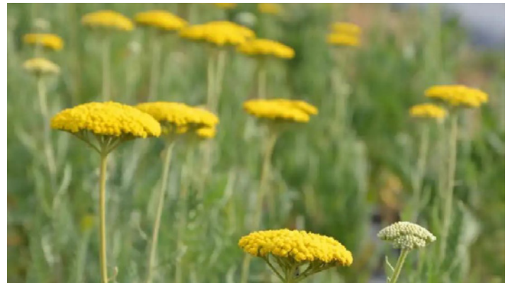
Achillea filipendulina 'Parker's Variety'