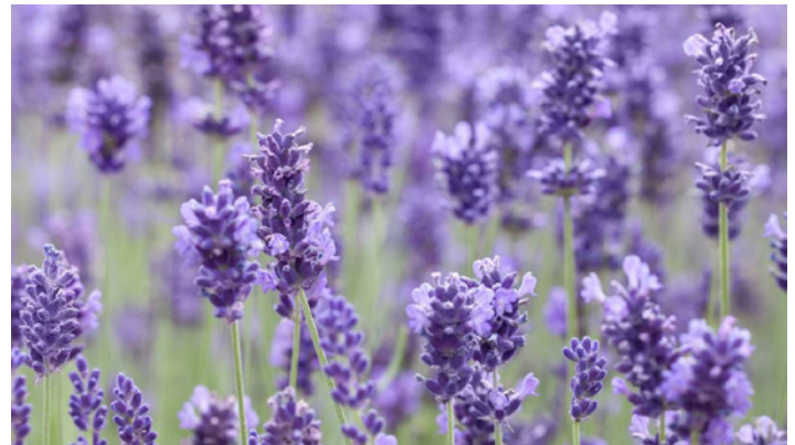
Lavandula angustifolia 'Hidcote'