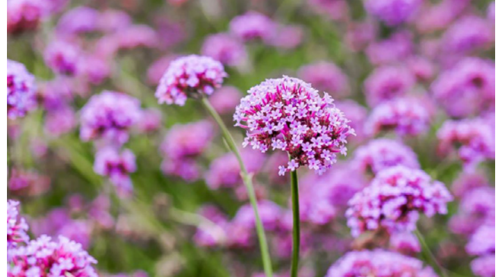
Verbena bonariensis 'Lollipop'